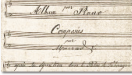
* V. Murad'ın Çırağan Sarayı'na hapsedilmesinden sonra eserleri bestelediğine dair nota kapağına yazdığı açıklama.

sunu, parçaları yerinde tutan kuvvetli bir tutkal gibi kullandım. Fikirlerimi oluştururken “Gölgeler: Rüyalarda” başlıklı makalesinde “Rüyalarım benim kadar aldanmaz. Hatta bazan onlar benim gözlerimi açar. Daha iyi görmek ve hissetmek için bana yardım ederler. Gündüzleri, sebebini kendime izah edemediğim bazı şeylerin sırlarını rüyalarım buldular ve bana öğrettiler” diye yazan Abdülhak Şinasi Hisar'ın aktardığı hisler, bana bu arayışında yol gösterdi. Dolayısıyla baleyi V. Murad'ın gördüğü hayali bir rüya içerisinde, şuurunda canlandığı